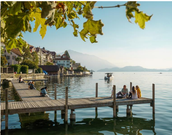
รับประทานอาหารกลางวัน ณ ภัตตาคารอาหารพื้นเมือง